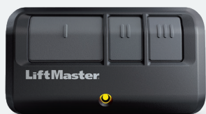
893LM (Quantité : 2)

Télécommandes à 3 boutons Active jusqu'à trois ouvre-portes ou accessoires d'éclairage myQ. Protections pour votre maison avec Security+ 2.0.